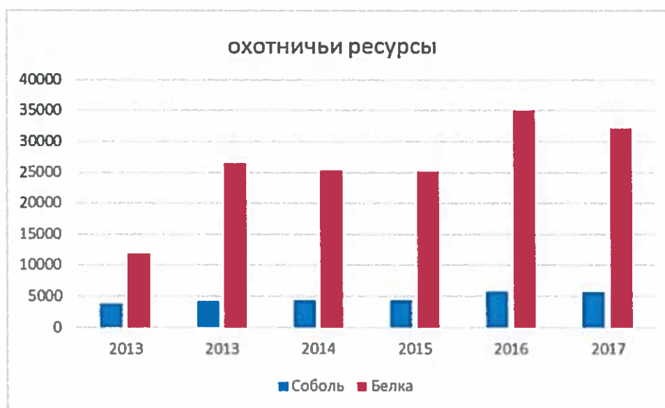
Рис.2. Динамика численности соболя и белки 2012-2017 гг.

Из анализа динамики можно сделать вывод, что критичного уменьшения численности зонтичных видов не наблюдается, изменения не выходят за рамки среднестатистических.